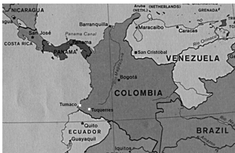
Figura 3 Mapa que muestra la ubicación de las ciudades de Maracaibo, Caracas y San Cristóbal (Venezuela), y Tumaco y Tuquerres (Colombia).

y Caracas) el genotipo CagA+/s1m1 es el más prevalente 31 . En un estudio, realizado en la ciudad de Maracaibo en 32 pacientes, 16 mestizos y 16 de la etnia Wayuu, la seropositividad de la IgG sérica anti-CagA fue del 94 y el 75%, respectivamente 32 . La infección con este tipo de cepas se vincula con el desarrollo de lesiones precancerosas y cáncer 33,34 . En un estudio con pacientes colombianos, se reportó que las cepas de H. pylori que expresan elevados niveles de CagA se asocian a lesiones precancerosas más avanzadas 35 .