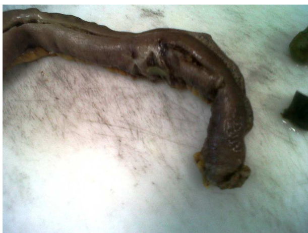
Figura 5 Imagen de la pieza quirúrgica: se puede ver la isquemia producida por el bezoar.