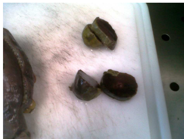
Figura 6 Bezoar seccionado.

le realiza una radiografía simple de abdomen en la que se objetiva dilatación de asas hasta yeyuno (figs. 1 y 2). En la tomografía computarizada (TAC) abdominal se describe una lesión ovalada que impresiona de invaginación intestinal en vacío derecho (figs. 3 y 4). Con el diagnóstico de obstrucción intestinal, se decide intervención quirúrgica urgente. Se observa íleo mecánico de delgado en el yeyuno medio por invaginación y bezoar intestinal de 6 \times 4 \times 3 cm, con 2 zonas de invaginación y ulceración de la serosa. Se realiza una resección de unos 40 cm de delgado y anastomosis