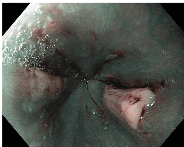
Figura 2 Úlceras en espejo en tercio distal del esófago vistas mediante imagen de banda estrecha (NBI), la cual resalta patrones vasculares y zonas de hemorragia.