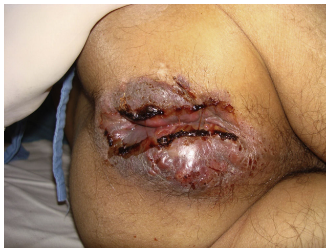
Figura 1 Tumoración anal en su presentación a urgencias.

Varón de 40 años de edad, sin antecedentes patológicos, diagnosticado con enfermedad hemorroidal grado III por anoscopia. Se descartó problema orgánico proximal tras realizar rectosigmoidoscopia flexible hasta 55 cm del margen anal. Se realiza hemorroidectomía tipo Ferguson de los 3 paquetes principales. Se egresa a las 24 h. Fue dado de alta de la consulta externa a los 30 días, con heridas cicatrizadas, sin datos de infección. Reporte histopatológico; paquetes hemorroidales con ingurgitación. Acude a los 45 días, posterior al alta de consulta externa por dolor anal, sensación de masa, sangrado y diarrea. A la exploración se encuentra en la región perianal una tumoración de 8 × 8 cm circunferencial, indurada, hiperémica y violácea (fig. 1). Limitada al conducto anal sin afección del recto. Se realiza prueba de ELISA para VIH y confirmatoria con Western-Blot positiva, no se contaba con dicha prueba previa a la cirugía. Se realiza toma de biopsia. El estudio histopatológico con inmunohistoquímica reportó linfoma no-Hodgkin difuso con inmunofenotipo B. Tomografía