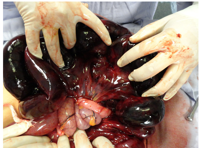
Figura 2 Imagen del sitio de torsión de vólvulo ileal.

La mortalidad que se ha reportado es del 15-73%, siendo el choque séptico la principal causa. Su disminución se relaciona con la presencia de un colon no gangrenado 1 , por lo que es imperativo el tratamiento mediante resucitación agresiva de líquidos, antibióticos y una efectiva cirugía individualizada y dirigida de acuerdo a los hallazgos operatorios y condición del paciente.