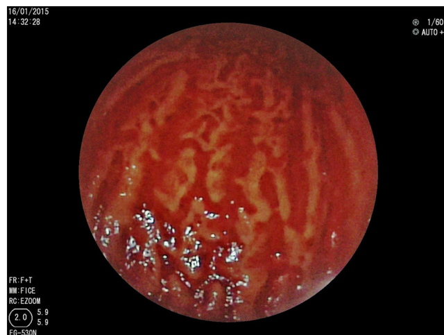
Figura 1 Ectasias vasculares en cuerpo gástrico «estómago en sandía».

La EVG puede presentarse como sangrado digestivo alto, sangrado oculto con anemia, o bien como dolor abdominal. En nuestros casos encontramos sangrado digestivo y anemia, como manifestación de EVG, que corrigió posterior al tratamiento con EAP (fig. 2) en los casos 1 y 2, y en el caso 3 se logró cohibir el sangrado activo en ambos episodios. Al igual que lo reportado en la literatura encontramos asociación con enfermedades autoinmunes y tratamiento inmunosupresor 1,4,6 . El tratamiento en adultos para la EVGA comprende manejo endoscópico con EAP, fotoablación con láser, crioterapia con óxido nítrico y coagulación con