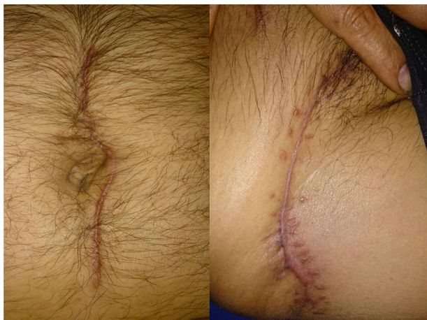
Figura 2 Se observa resultado final con heridas cicatrizadas y sin datos de infección.

muy favorable con normalización de las cifras de leucocitos en sangre (6.06 miles/ \mu l), procalcitonina (0.08 ng/ml) y proteína C reactiva (0.71 ng/dl). Debido a la buena evolución se decide cerrar la herida quirúrgica donde estuvo colocado previamente el VAC y se retira el drenaje abdominal a las 3 semanas, ya con gasto mínimo y seroso (fig. 2).