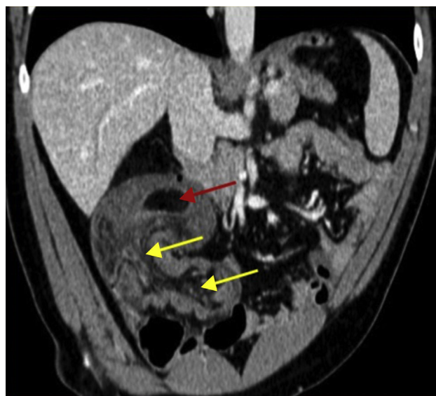
Figura 1 Reconstrucción coronal de la TC abdominal donde se observa la cabeza de la invaginación que corresponde a un lipoma (flecha roja) y la gran invaginación íleo-cólica con vasos y grasa mesentérica dentro de la luz del colon (flechas amarillas).

el extremo ileal altamente sugestiva de lipoma, dato que posteriormente confirma el estudio anatomopatológico. El paciente evoluciona favorablemente y es dado de alta al 8.º día de la intervención.