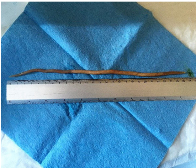
Figura 2 Ascaris lumbricoides de 27 cm de longitud.