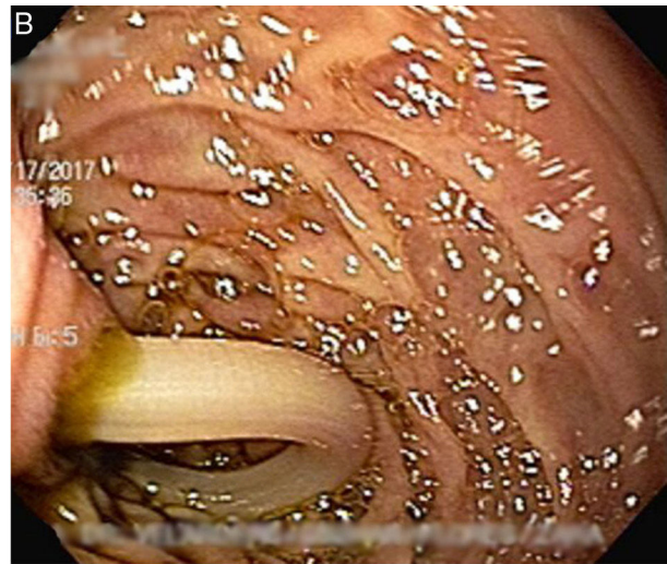
Figuras 1A y 1B A y B) Nematodo ocluyendo el ámpula de Vater.