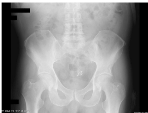
Figura 1 Radiografía simple de abdomen con prótesis dental en sigmoides.

No se recibió patrocinio de ningún tipo para llevar a cabo este artículo/estudio.