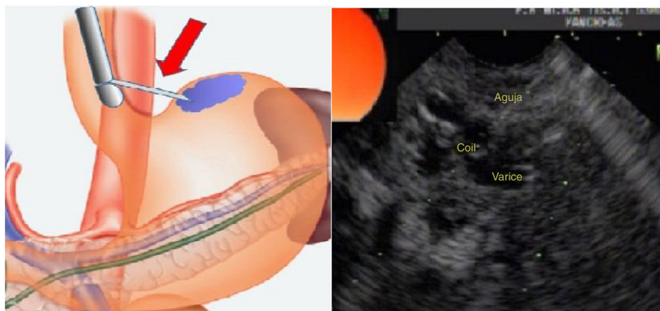
Figura 1 Esquema de la punción transesofágica. Inserción ecoendoscópica de coil y cianoacrilato.

El tratamiento de primera elección en la hemorragia varicosa gástrica es la inyección endoscópica de CYA dentro de las várices. Su combinación con un monitoreo por ecoendoscopia y dópler permite asegurar la obliteración completa de las várices, lo que disminuye las posibilidades de resangrado 9 . La colocación ecoendoscópica de coils de acero inoxidable durante la misma sesión disminuye el riesgo de embolización sistémica de CYA. El coil más utilizado en várices fúndicas es el espiralado con fibras sintéticas adheridas en la superficie, que inducen trombosis y evitan la dispersión del CYA. El tamaño del coil depende del tamaño de la várice, habitualmente se utilizan de 10 a 20 mm de diámetro. En cada procedimiento se pueden introducir uno o más coils.