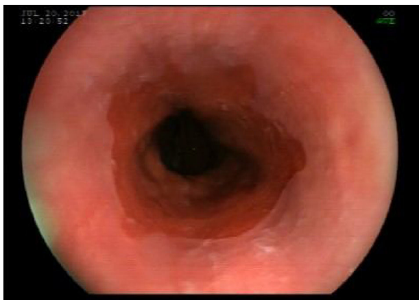
Figura 3 VGC de control, mucosa esofágica sin lesiones.