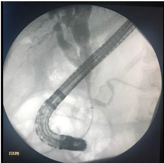
Figura 2 CPRE que muestra dilatación quística de la vía biliar intrahepática y de la vía biliar extrahepática proximal. Nótese la desembocadura conjunta del conducto pancreático y del conducto biliar.