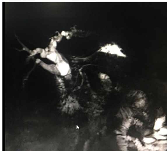
Figura 1 Colangio-RMN que muestra dilatación quística de la vía biliar intrahepática y de la vía biliar extrahepática proximal.

Mujer de 39 años referida a nuestro centro para evaluación diagnóstica de colestasis no sintomática. Se le realizaron colangiografía por resonancia magnética nuclear (colangio-RMN) (fig. 1) y colangiopancreatografía retrógrada endoscópica (CPRE) (figs. 2 y 3); en ambas se evidencia marcada dilatación quística de la vía biliar extra e intrahepática con vía biliar intrapancreática normal. En la CPRE se observa inserción conjunta del conducto pancreático y del conducto biliar (fig. 2). La incidencia de los quistes de colédoco congénitos es de 1/100,000 a 1/150,000 y la causa más aceptada es la desembocadura conjunta de los conductos biliar y pancreático.