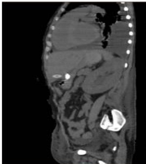
Figura 1 TAC en corte sagital donde se aprecia el trayecto de la sonda a través del segmento III hepático.

Por el riesgo de sangrado y el pronóstico de la enfermedad de base, se decidió no retirar la sonda. La paciente permaneció estable y sin dolor, por lo que una semana después se realizó una TAC abdominal con contraste a través de la sonda, sin evidencia de fugas y con adecuado paso del mismo hacia la cámara gástrica (fig. 3).