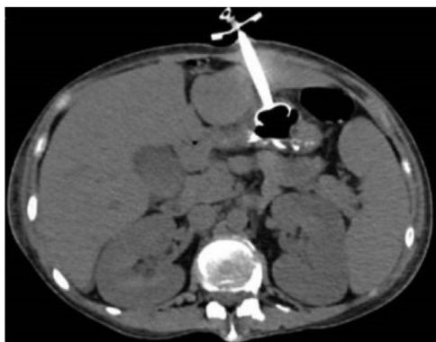
Figura 3 TAC en corte axial con botón interno intragástrico sin fuga de medio de contraste.

al 95%. Las indicaciones más frecuentes son los trastornos neurológicos, seguidos de tumores de cabeza y cuello 2 . Las contraindicaciones son: coagulopatía, ascitis marcada, infección de la pared abdominal, oclusión intestinal, carcinomatosis, várices gástricas o interposición de un órgano 3 .