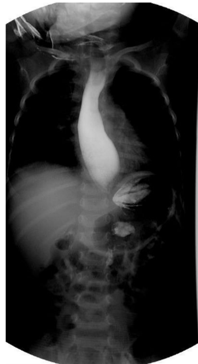
Figura 1 Serie esofagogastroduodenal que muestra esófago dilatado a nivel de la unión esofagogástrica, disminución acentuada de la luz esofágica distal e imagen en «pico de ave».

Los recién nacidos a término presentan lágrimas desde el primer día de vida, producción desarrollada completamente entre la 1-7 semanas de vida. La alacrimia se considera un