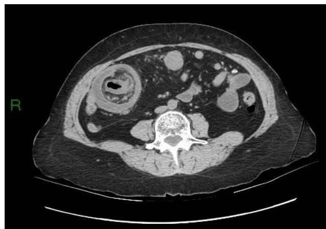
Figura 1 TC abdominal que muestra una intususcepción ileocecal.

abdominal, constipación, diarrea y sangre en heces (tabla 1). La duración mediana de los síntomas, de inicio a diagnóstico, fue de 18 días (rango de 1-365 días). Un 17.86% (n = 5) de los pacientes presentaron síntomas agudos, un 17.86% (n = 5) síntomas subagudos y un 64.28% (n = 18) síntomas crónicos. Once pacientes (39.28%) tuvieron síntomas durante más de un mes.