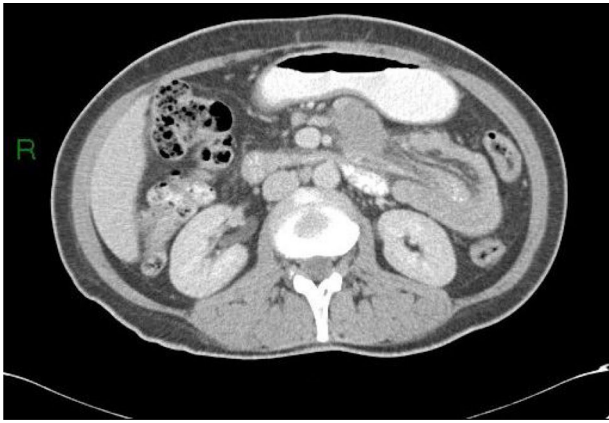
Figura 2 TC abdominal que muestra una intususcepción entero-enterica.