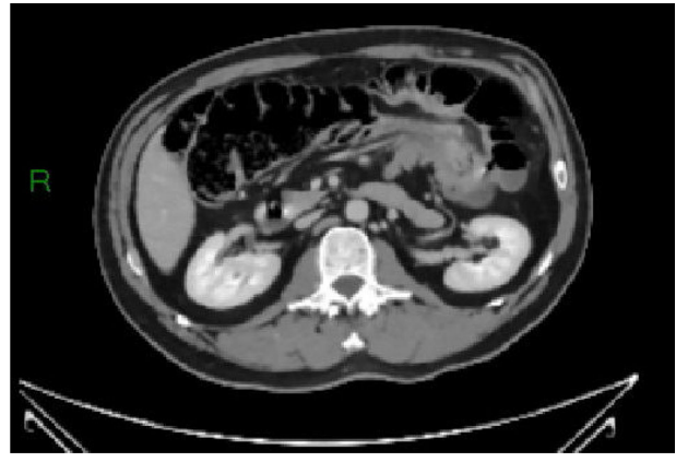
Figura 4 TC abdominal que muestra una intususcepción colocolónica.