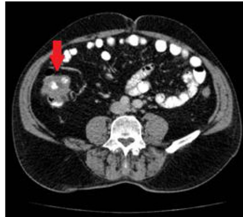
Figura 2 TC toracoabdominal en la que se aprecia engrosamiento mural del colon ascendente (flecha).

en sentido distal. En el resto de la exploración solo se objetivaron divertículos no complicados.