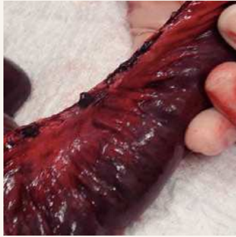
Figura 3. Trombosis venosa mesentérica.