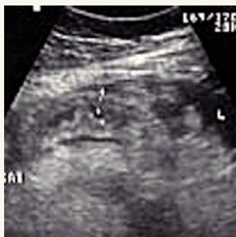
Figura 1. Ecografía abdominal con engrosamiento de las paredes del intestino.

interior de la vena mesentérica, ascitis y suboclusión intestinal ( Figura 2 ). Se realizó una intervención quirúrgica en la que se encontró una trombosis venosa mesentérica del yeyuno ( Figura 3 ). Se realizó resección de 140 cm del yeyuno ( Figura 4 ). La trombosis venosa mesentérica se presenta en diferentes trastornos, en los cuales la iniciación clínica más frecuente es el dolor abdominal, con síntomas y signos que progresan hacia el infarto intestinal. Cuando se presenta en pacientes más jóvenes, tiene una evolución clínica más indolente e inespecífica. El tratamiento es la intervención quirúrgica de urgencia con anticoagulación inmediata.