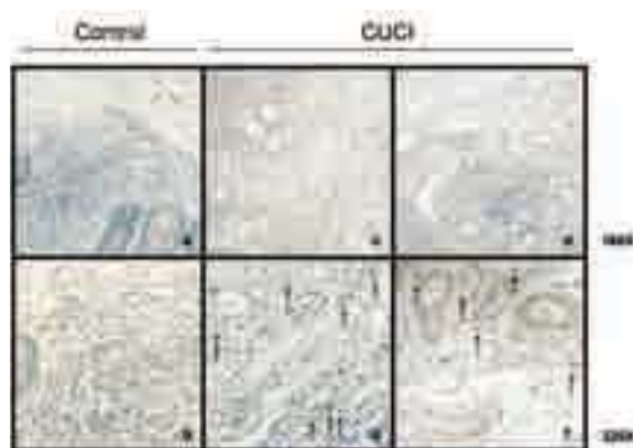
■ Figura 2. Expresión de la IL-10 en el tejido intestinal de pacientes con CUCI activo y controles. A. Muestra representativa de un control a 160X. B. Tejido del mismo control a un aumento de 320X. C. Muestra de un paciente con CUCI a 160X. El infiltrado inflamatorio crónico se encuentra constituido principalmente por macrófagos, linfocitos y células plasmáticas. D. Tejido del mismo paciente a 320X. Las flechas señalan las células inmunorreactivas a IL-10 presentes en la mucosa. E. Muestra representativa de un paciente con CUCI a 160X. F. Tejido del mismo paciente a 520X. Las flechas señalan las células perivasculares productoras de IL-10.

podría explicarse por el hecho de que existe una disminución en las poblaciones de células específicas, tales como células epiteliales o T reguladoras, una respuesta anormal a estímulos específicos, o una disminución de la afinidad de la IL-10 a sus receptores.