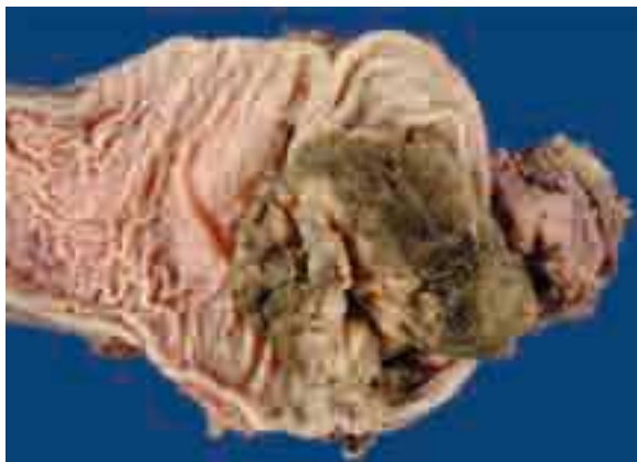
■ Figura 2. Pieza quirúrgica.