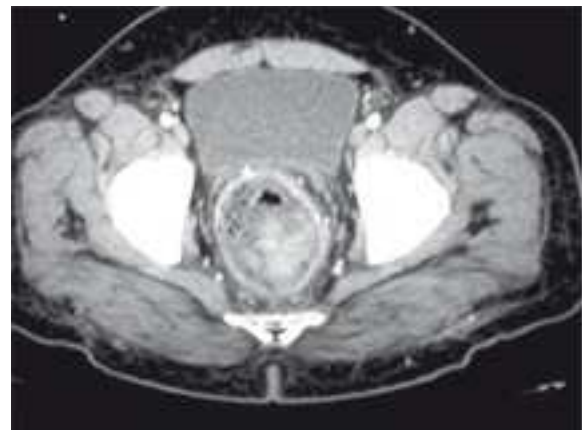
■ Figura 1. Imagen tomográfica pélvica, con lesión intraluminal a nivel de recto.

Los melanomas malignos son una entidad muy rara y representan menos de 1% de los tumores malignos colorrectales, pudiendo ser lesiones pigmentadas (melanóticas) o sin pigmento (amelanóticas) lo que ocurre en poco menos de 30% de