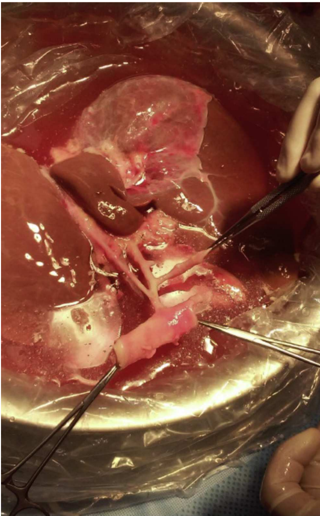
Figura 3 Arteria celíaca con sus ramas: arteria esplénica, arteria gástrica izquierda y arteria hepática propia. Es de notar que la arteria hepática izquierda se origina de la arteria gástrica izquierda (anatomía vascular tipo 2 descrita en la nomenclatura de Couinaud).