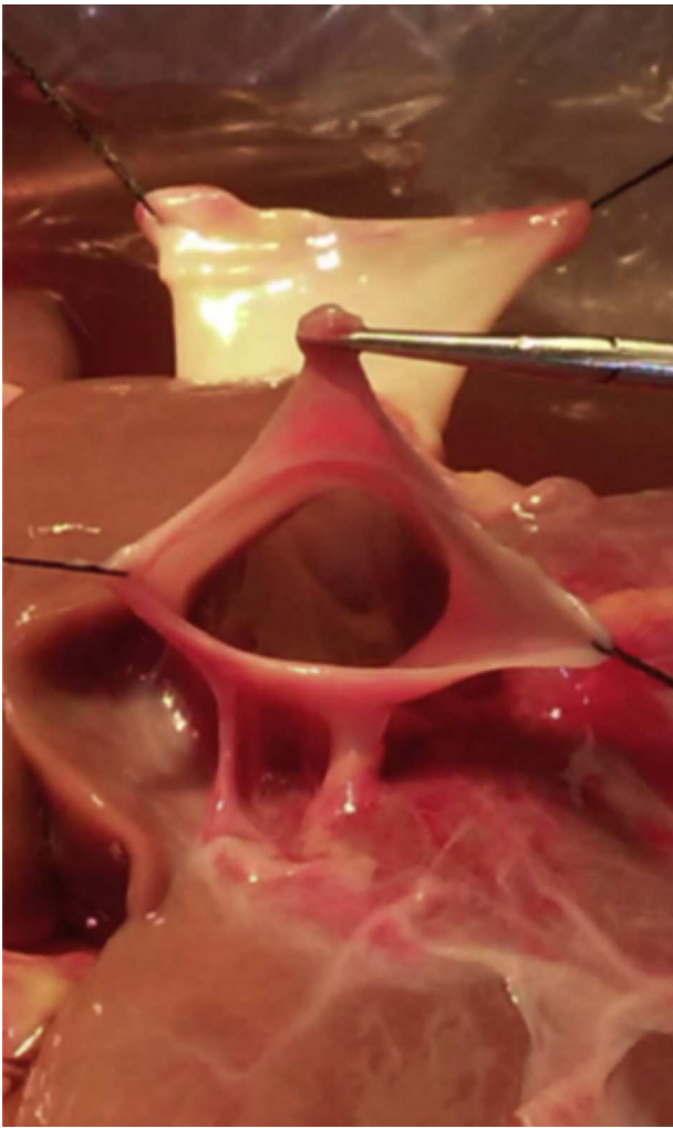
Figura 1 Vena cava inferior disecada.