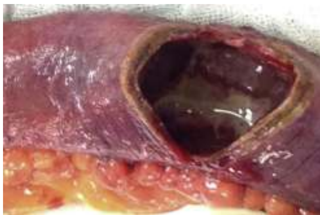
Figura 4 Intestino delgado con isquemia segmentaria y necrosis en parches de la mucosa.