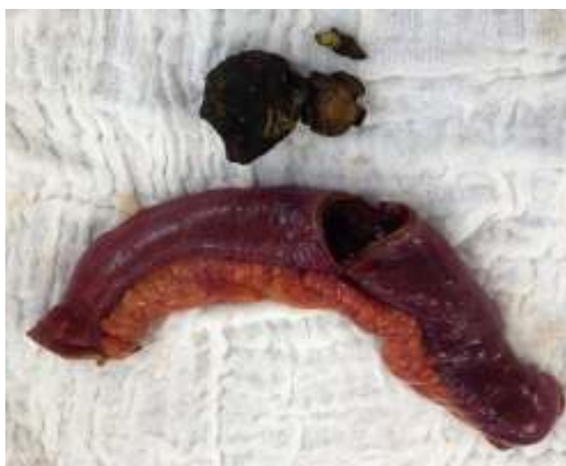
Figura 5 Imagen de la pieza quirúrgica y cálculo.