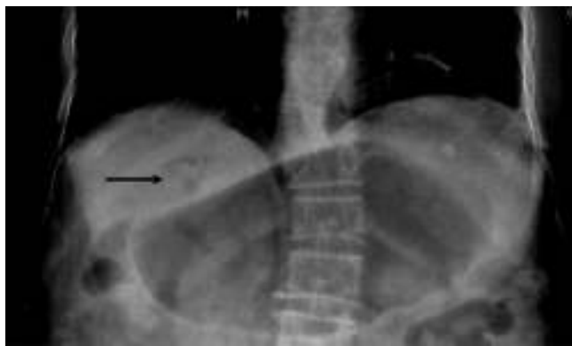
Figura 2 Placa de tórax donde se observa dilatación gástrica y neumobilia (flecha negra).