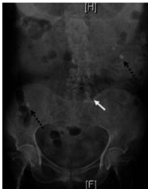
Figura 1 Radiografía de abdomen con distensión gástrica, dilatación de asas intestinales (flecha blanca) y cálculos biliares ectópicos (flechas negras punteadas).

El íleo biliar es una causa rara de obstrucción intestinal, la radiografía abdominal puede mostrar obstrucción del intestino delgado, neumobilia y cálculo biliar ectópico (tríada de Rigler) en menos del 30% de los pacientes. Presentamos el caso de una mujer de 80 años, con diagnóstico de colecistitis crónica litiásica desde hace 4 años, sin tratamiento. La exploración física y el interrogatorio clínico fueron compatibles con obstrucción intestinal, además presenta datos clínicos y bioquímicos de síndrome de respuesta inflamatoria sistémica (fiebre, taquicardia y leucocitosis) e irritación peritoneal. Se realizó placa simple de abdomen y tele de tórax (figs. 1 y 2) con hallazgo de distensión gástrica y tríada de Rigler. La tomografía de abdomen corroboró el diagnóstico de íleo biliar (fig. 3). Durante la laparotomía se identificó cálculo biliar de 5 × 4 × 4 cm, localizado a 1 m del ángulo de Treitz, intestino delgado (fig. 4) con isquemia segmentaria y necrosis en parches de la mucosa. Se realizó resección de 20 cm de yeyuno con entero anastomosis latero-lateral mecánica (fig. 5). La evolución posquirúrgica fue satisfactoria.