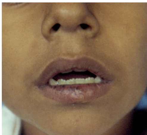
Figura 1 Máculas hipercrómicas en los labios.

labios, las cuales fueron aumentando en número y diámetro (fig. 1) y desde los 6 años de edad aparecieron manchas hipercrómicas de características similares en palmas y plantas. Las manchas en las plantas se encontraban en ambos pies y abarcaban además de la región de los ortejos, la región del metatarso y los talones (fig. 2). Los estudios de imagen y endoscópicos confirmaron la presencia de pólipos en el colon y en el intestino delgado (fig. 3); el estudio histopatológico de los mismos confirmó que correspondían al tipo hamartomatoso (fig. 4). El síndrome de Peutz-Jeghers se caracteriza