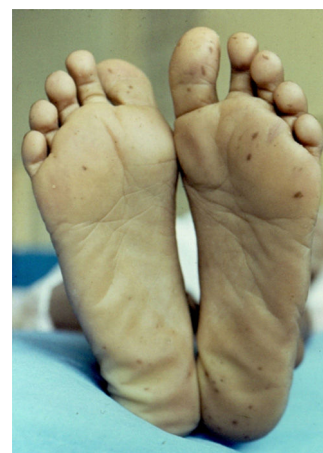
Figura 2 Lentigo plantar diseminado asociado con el síndrome de Peutz-Jeghers.

* Autor para correspondencia. Hospital Ángeles Lindavista, Río Bamba 639-330, 07760 Ciudad de México. Teléfono: 57-54-85-04 y 57-54-84-08.