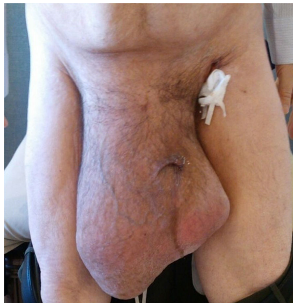
Figura 1 Masculino de 55 años con historia de hernia inguino-escrotal derecha de 30 años de evolución.

Paciente masculino de 55 años, con historia de 30 años de hernia inguino-escrotal gigante (fig. 1), que acude a urgencias por obstrucción urinaria. Se le colocó sonda de Foley; se realizó angiogramía abdominal, la cual mostró: intestino delgado dentro de saco herniario inguino-escrotal derecho sin afectación vascular (figs. 2 y 3); los valores de laboratorio eran normales. Se hospitalizó al paciente colocando, mediante aguja de Veress, un catéter Tenckhoff en el cuadrante superior izquierdo de abdomen (fig. 4), efectuando insuflación (800 a 1,000 c.c.) de aire ambiental en cavidad abdominal, con monitorización de la presión intraabdominal mediante la sonda de Foley conectada a transductor eléctrico de presión; la máxima presión intraabdominal alcanzada de manera paulatina fue de 20 cmH 2 O, correspondiendo a 27.9 mmHg. En el décimo día de hospitalización mediante cirugía se efectuó la colocación del intestino en la cavidad abdominal y resección del saco herniario, y la pared abdominal fue reforzada con malla compuesta. El paciente presentó un postoperatorio sin complicaciones (fig. 5). Este tipo de cirugía representa el modelo de tratamiento que puede ofrecerse a pacientes con hernia inguino-escrotal gigante 1-3 , permitiendo una calidad de vida satisfactoria.