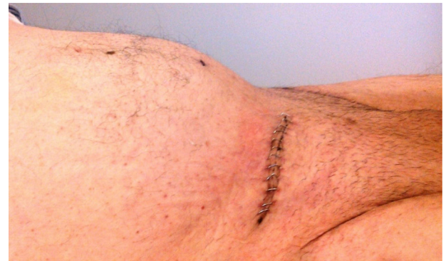
Figura 5 Cicatriz de incisión inguinal derecha de 8 cm de longitud en paciente con hernia inguino-escrotal previa.

normas éticas del comité de experimentación humana responsable y de acuerdo con la Asociación Médica Mundial y la Declaración de Helsinki.