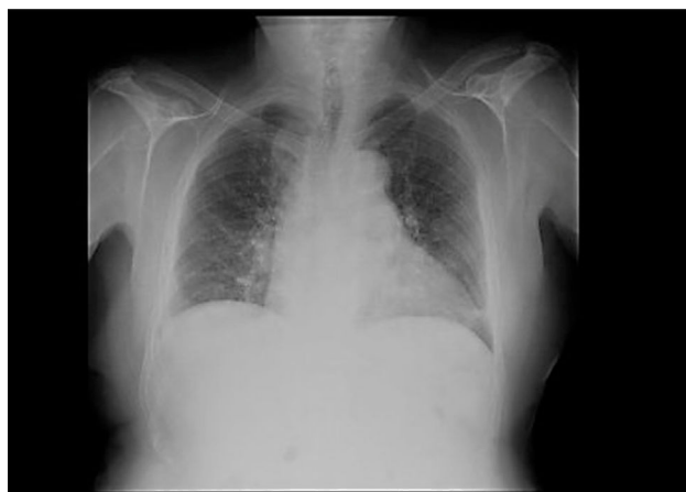
Figura 2 Radiografía de tórax en proyección posteroanterior, con atelectasia en el lóbulo pulmonar inferior izquierdo.