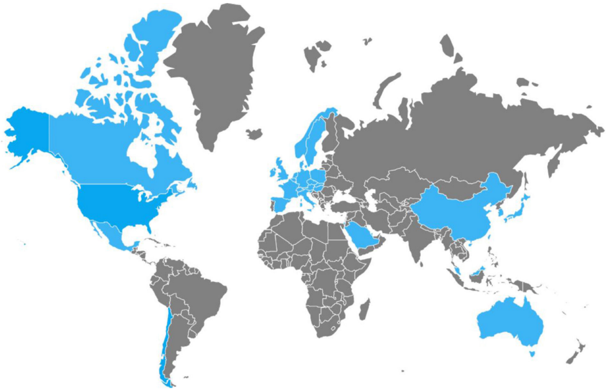
Figura 2 Países donde la cepa NAP1/B1/027 de Clostridium difficile ha sido aislada.

urgencia secundario al desarrollo de colitis fulminante, presentando una tasa de mortalidad a 30 días que oscila entre el 6 y el 30%. En 2014, Camacho-Ortiz et al. 49 reportaron por primera vez el aislamiento de la cepa NAP1/B1/027 en nuestro país, y pese a que en la actualidad la atención se encuentra sobre ella, es muy probable que nuevas cepas hipervirulentas continúen emergiendo, siendo necesaria la realización de vigilancia epidemiológica continua para la identificación temprana de nuevos casos.