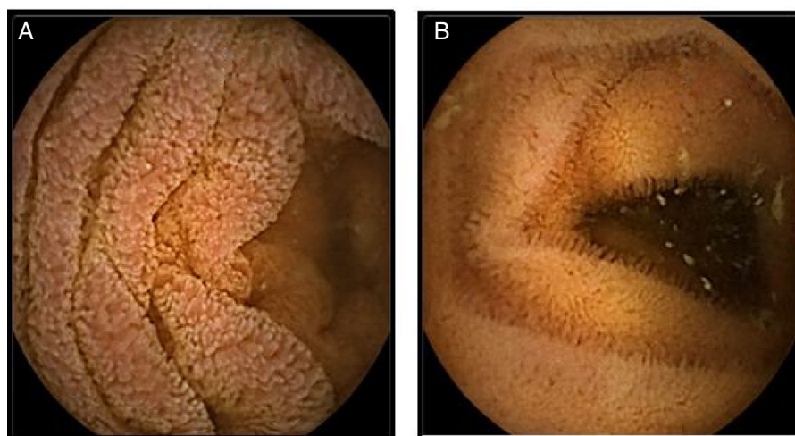
Figura 2 Cápsula endoscópica. A) Mucosa con edema, eritema que produce engrosamiento de vellosidades. B) Control con desaparición del edema y eritema con normalización del grosor de las vellosidades.

pacientes. Según la descripción clásica de Talley et al. 3 , la gastroenteritis eosinofílica tiene tres formas de presentación: la primera es predominantemente mucosa, en la segunda predomina el compromiso de la capa muscular y la tercera es subserosa. En nuestro caso hay evidencia de compromiso mucoso y seroso documentados mediante estudios endoscópicos e histopatológicos, además de descartar de forma exhaustiva diagnósticos diferenciales.