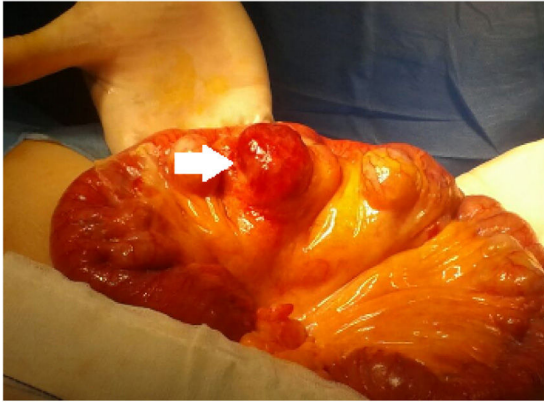
Figura 2 Se realiza laparotomía media, identificando múltiples divertículos en yeyuno proximal a 40 cm del ángulo de Treitz, uno de ellos mostraba una perforación en el borde anti-mesentérico.