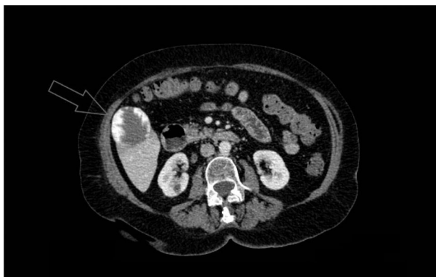
Figura 2 TC de abdomen con contraste iv en corte axial: lesión focal con captación nodular periférica (de aproximadamente 5,1 \times 4,6 cm) localizada en segmento V hepático compatible con hemangioma exofítico.

Confidencialidad de los datos. Los autores declaran que han seguido los protocolos de su centro de trabajo sobre la publicación de datos de pacientes.