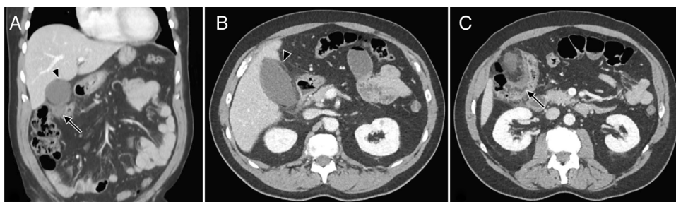
Figura 1 A. Corte coronal, presencia de cambios inflamatorios pericolecísticos (punta de flecha) y un flemón pericólico (flecha). B. Corte axial, cambios inflamatorios perivesiculares, estriación de la grasa a este nivel, datos que pudieran indicar un cuadro de colecistitis aguda. C. Corte axial, engrosamiento de la pared del colon del ángulo hepático y estriación de grasa pericolónica, con enfermedad diverticular activa.