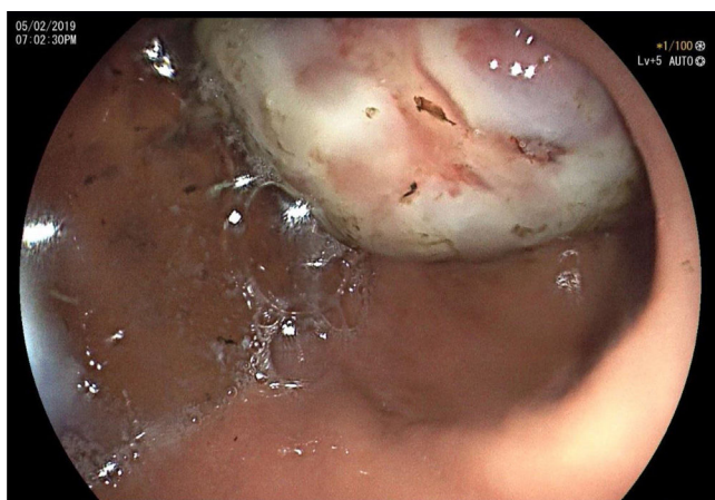
Figura 1 Imagen endoscópica en donde se observa tumoración en antro gástrico.