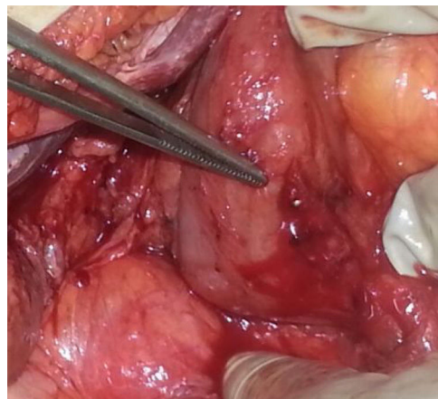
Figura 1 Perforación duodenal parcialmente cerrada con el sistema OVESCO con la pinza endoscópica atrapada.

Se decidió intervenir a la paciente de forma urgente, evidenciándose una perforación de aproximadamente 2 cm en pared posterior duodenal parcialmente ocluida con el OVESCO, con la pinza endoscópica atrapada en la oclusión y exteriorizada a través de la pared duodenal (fig. 1). Se realizó maniobra de Kocher amplia, duodenotomía para extracción del dispositivo (fig. 2) y cierre en monoplano de la perforación con epiploplastia. Se colocó yeyunostomía de alimentación. La paciente evolucionó favorablemente, reintroduciéndose la dieta oral con buena tolerancia, y siendo dada de alta 14.º día postoperatorio.