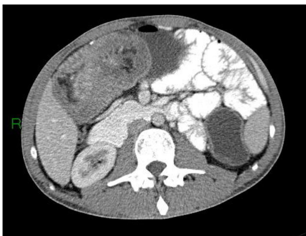
Figura 3 TC abdominal que muestra una intususcepción ileocolonica.